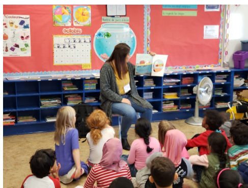
Semaine de la lecture Étudiants du Campus St-Jean sont venus lire des histoires aux élèves de maternelle à 6 e année.