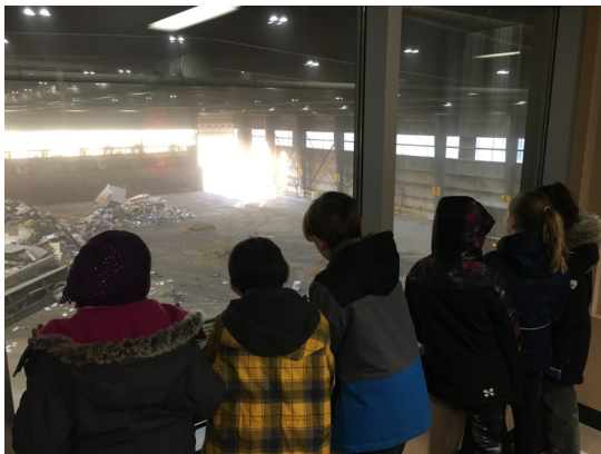
Visite au Edmonton Waste Management Centre 4 e année: 29 octobre