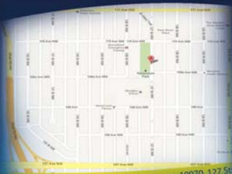
Camp at Westmount Community League - 10970, 127 Street