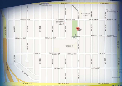
Camp at Westmount Community League - 10970, 127 Street NW