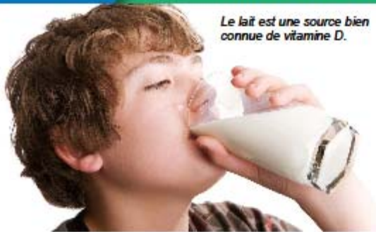
Le lait est une source bien connue de vitamine D.