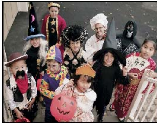
L'Halloween, c'est amusant pour les enfants, mais c'est aussi le temps de se souvenir de conseils de sécurité importants.

Et surtout, amusez-vous, ramassez beaucoup de gâteries et faites-le en toute sécurité.