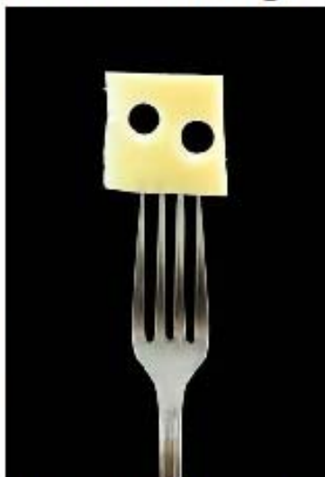
Un simple morceau de fromage contient des éléments nutritifs qui aident à protéger les dents contre la carie.